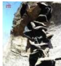
Gambar 1. Auricularia nigricans (Nadir, dkk. 2020).

Tubuh buah Auricularia kaya akan polisakarida termasuk antioksidan, antitumor (Zhang, dkk., 2017), antikoagulan (Khatua, dkk., 2017), imunomodulator (Bandara, dkk., 2019), dan aktivitas hepatoprotektif (Eze, dkk., 2014). Jamur kuping mengandung alkaloid, tannin, terpenoid, karbohidrat, polifenol, flavonoid, steroid, glikosida (Singh dan Tripathi, 2018; Sanico dan Vicencio, 2019). Berikut salah satu gambar spesies jamur dari Genus Auricularia .