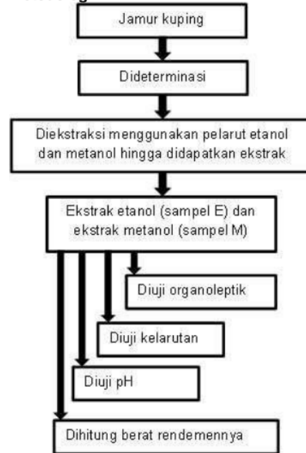
Gambar 2. Kerangka prosedur.