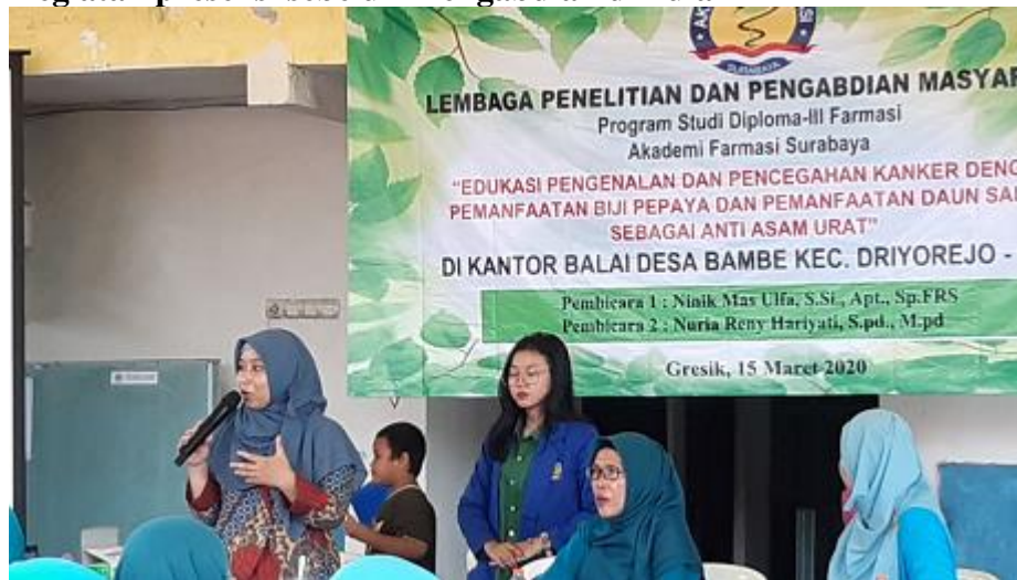
Penyampaian Materi Pemanfaatan Daun Salam oleh Dosen