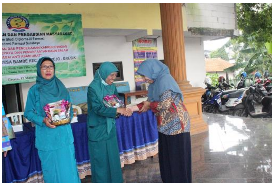
Pemberian doorprize kepada peserta yang bertanya