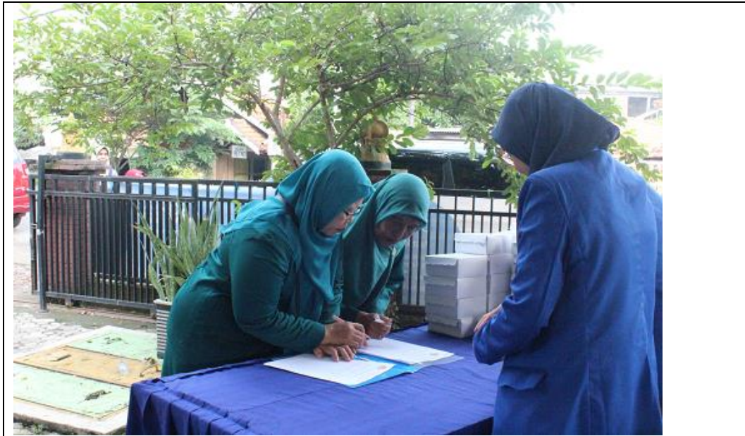
Kegiatan presensi sebelum Pengabdian dimulai