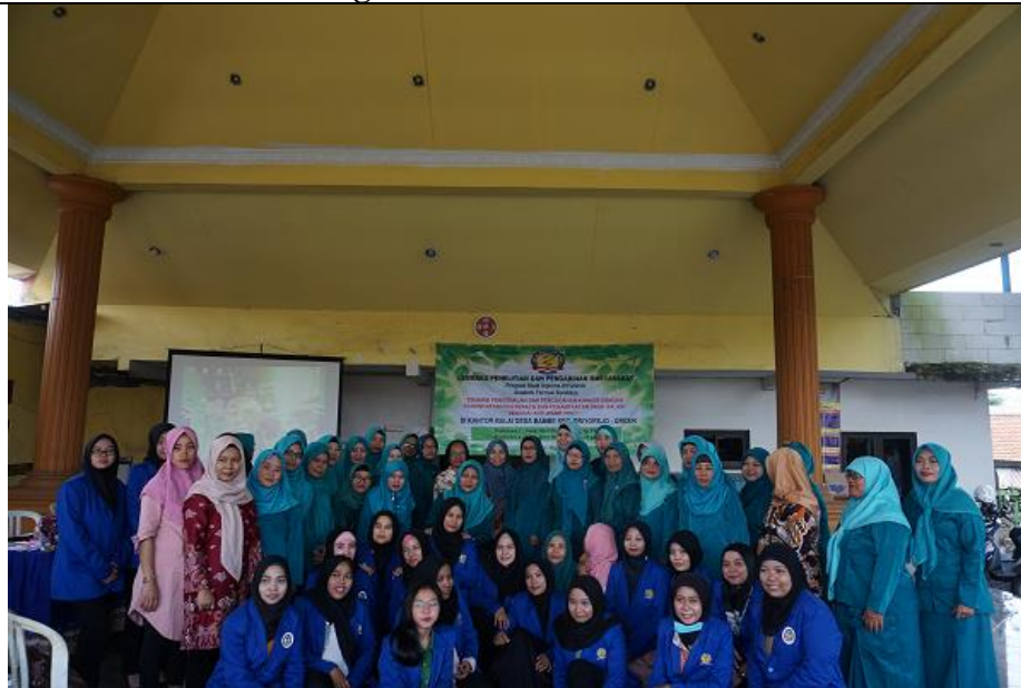
Foto Bersama peserta, mahasiswa, dan dosen setelah Selesai Pengabdian