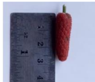
Gambar 1. Buah cabe jawa

Pemeriksaan makroskopis dan mikroskopis merupakan langkah awal sebelum melakukan identifikasi dan penetapan tingkat kemurnian suatu bahan. Inspeksi visual menjadi cara termudah dan tercepat untuk menetapkan identitas, kemurnian, dan kualitas. Jika sampel ditemukan berbeda secara signifikan dari spesifikasi dalam hal warna, konsistensi, bau atau rasa, maka dianggap tidak memenuhi persyaratan (WHO, 2011). Penampakan visual sampel segar buah cabe jawa terdapat pada gambar 1 berikut: